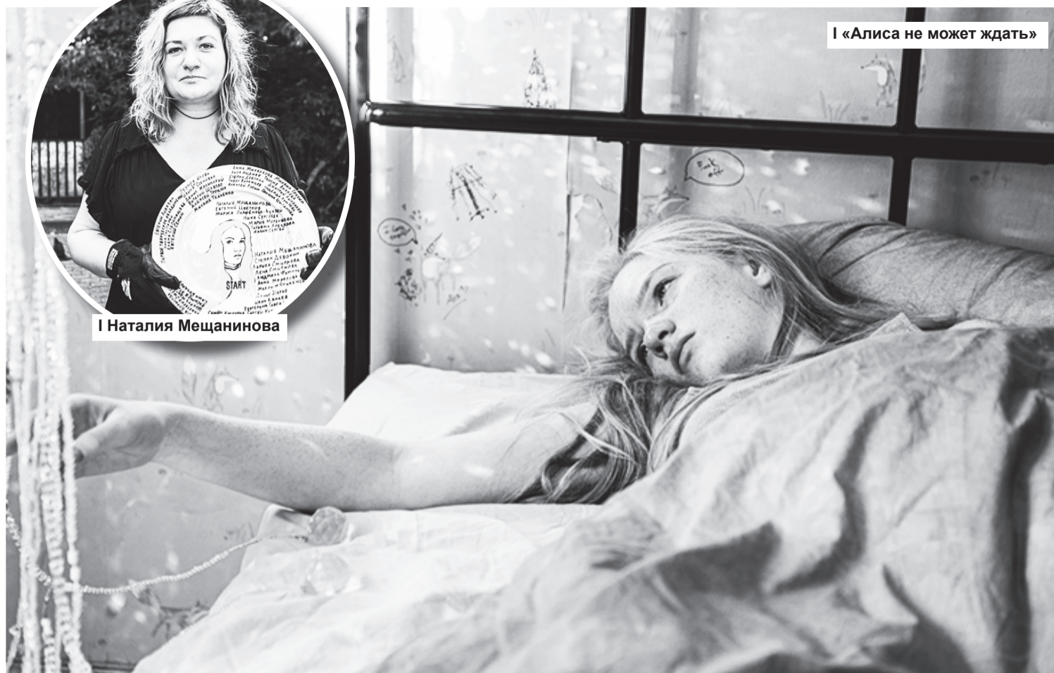
I «Алиса не может ждать»